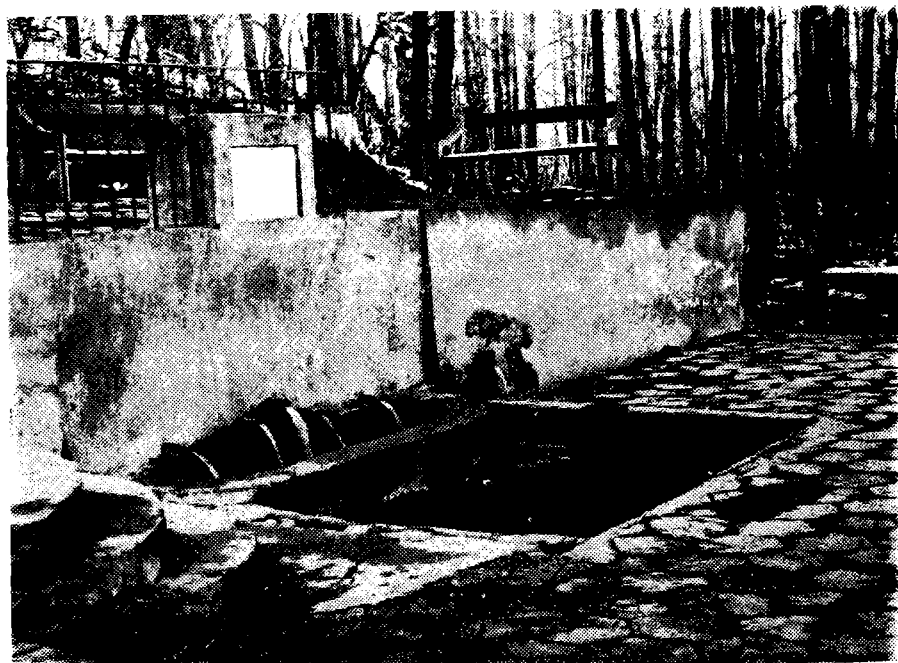
Сл. 5. „Школска чесма“ у Нишкој Бањи саграђена 1928. године. Термо-минерална вода истиче на шест лула. (Снимко аутор: 13. III 1980.)