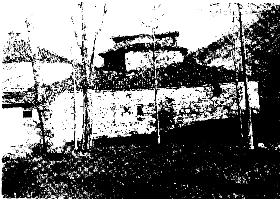
Сл. 2. Термално купатило у Новопазарској Бањи. У левом плану до-зидани део којим је купатило спојено са бањским хотелом. Саграђено је 1593/94. године. (Снимко аутор: 23. IV 1978.)