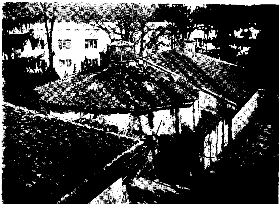
Сл. 3. Адаптирани термални хамам у Нишкој Бањи (Снимко аутор: 18. III 1980.)