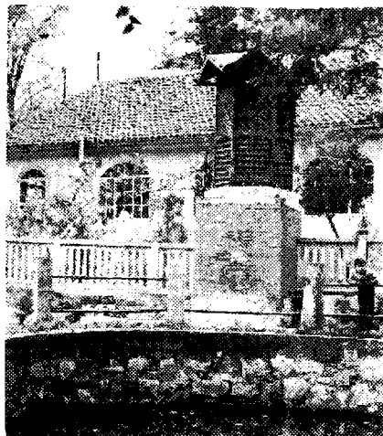
Сл. 8. Надзидани објекат крашкотермалне „Пантелејске воде“ изнад оголићене издани уз храм св. Пантелејмона у Нишу. На објекту је натпис „Вода — лековита“. (Снимно аутор: 7. XI 1974.)