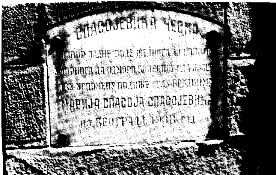
Сл. 6. Натпис на плочи Спасојевића чесме, подигнуте на минералном извору Баруљива Вода, у селу Брџанима (окр. Јана Г. Милановица). (Снимко аутор: 2. VI 1982.)