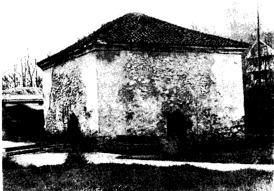
Сл. 1. Трансформисано средњовековно термално купатило у Јасаничкој Бањи. У XVII веку Турци су га претворили у хамам (Снимко аутор: 22. IV 1978.)