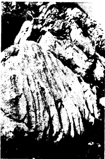
Сл. 3. — Шкрајске форме на главама кречњачких слојева Гувништа.

У истом таквом кречњаку, на Смордану, издубљена је она фосилизована вртача са slabим извором, на висини од 1480 м.