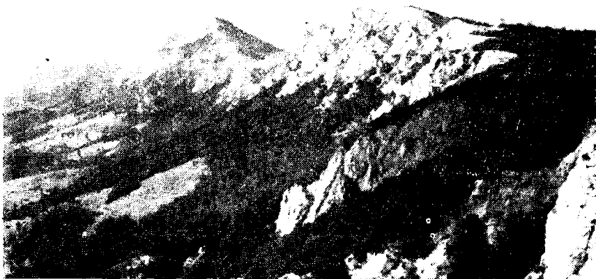
Сл. 1. — Део облукa Црвене реке од Смрдана до Голаша.

изерена ка северу. То разламање се, по свој прилици, вршило дуж једног меридијанског раседа, на који указују еруптивне жице код Горњег Присјана, затим у клисури Пусте реке и јужно од долине Лужнице, код Доњег Дејана; управо, тај расед прати Пуста река. Изгледа да пружање овог раседа прати и Топоничка река, главни крак Црвене реке, што би се могло судити на основу једне микро-гранитне инјекције (2, с. 11, профил 1). О разламању ове површи говоре нам још неке чињенице, на којима ћемо се нешто детаљније задржати.