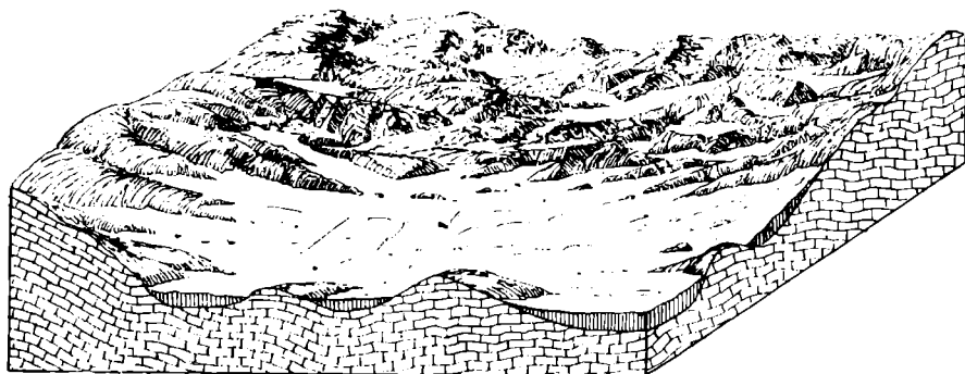
Ск. 3. — Увала у шравном региону Трема.

Планински врх Трем (1808 м) представља нешто ширу зараван, одсечену на северној страни процесом обурвавања, док је ка југу и југозападу благо нагнута; ту се у буавицама наилази на спорадична кварцна зрнца. На југозападној страни има неколико плићих вртача асиметричног облика, исто онако како падају кречњачки слојеви. На пречагама између вртача беласају се и штрче пространи шкрапари са осулинама, између којих расте оскудна травна вегетација на танком слоју буавица. Међутим, на југоистоку, у правцу коте 1721, види се једна увала. Она се пружа правцем ЗСЗ-ИЈИ, а дуга је преко 1 км и дубока око 80—100 м. На њеном дну је мноштво вртача. Тако су оне, према Трему, дубоке 20—25 м и широке 150—200 м; у једној од њих, на висини од 1750 м, нашли смо ситни кварцевити материјал у дебелим буавичним наслагама.