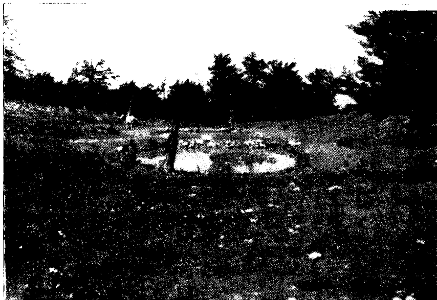
Сл. 5. — Дуга локва.

На простору Дуге локве, која представља део површи од 1400—1500 м изграђена је плитка вртача са локвом. И Смрдан одговара тој фази, на коме је удубљена плитка вртача са извором. Узроке слабог интензитета крашког процеса на овим местима морамо свакако тражити у чињеници, што су овде заступљени доломитични кречњаци, који се више дробе него разлажу, и што црвени делувијум игра улогу чепа на дну вртача.