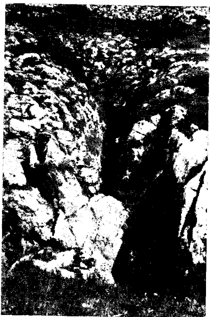
Сл. 4. — Улаз у леденицу Крстатајс провалије.

Нешто западније од Гувништа налази се једна велика асиметрична вртача, пречника око 80 м и дубине 10—12 м. Стрмија страна је на југо-западу, где се виде главе слојева и два фосилна понора постављена један изнад другог. На дну вртаче удубљена је леденица звана Крстата провалија. Отвор јој се налази на месту где се укрштају две пукотине под правим углом, од којих је шири она која иде правцем СЗ—ЈИ. Улаз у леденицу је мало издужен сагласно са широм пукотином, а окно је дубоко око 20 м.