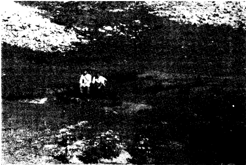
Сл. 2. — Стирање и поштивање црвеног делувијума у ували Ждребице.

На простору Велике црквене (на листу Ниш 1:100.000 — Црквенско Бучје) издубљена је увала правца ИСИ-ЗЈЗ. Дугачка је око 500 м, широка 200 м и дубока 40 м. На страни која је оријентисана ка Ждребици, на висини од 1385 м, расут је ситан шљунак од кварца и црвених глинаца. Такав материјал, и још крупнији, простире се и по ували Ждребице, и то на 1360—1380 м надморске висине.