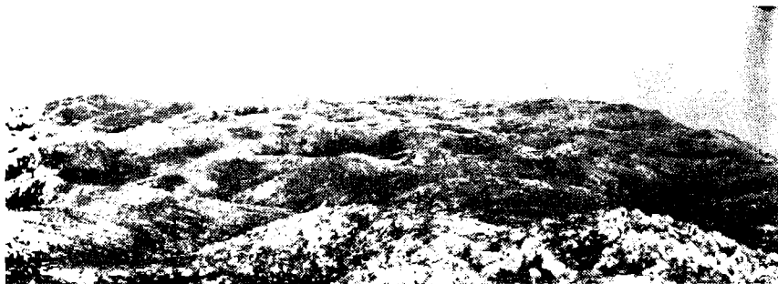
Сл. 6. — „Богиньави карси“ шифрбавачког дела Валожја.

Опште је познато да се количина угљен-диоксида, као релативно лаког гаса, смањује са повећањем надморске висине. То условљава, понављајући се ка планинским врховима, све слабији интензитет животних функција биљних заједница, као и пратећих биохемиских процеса. Све то и те како одражава на манифестовање крашких облика, што ћемо боље видети.