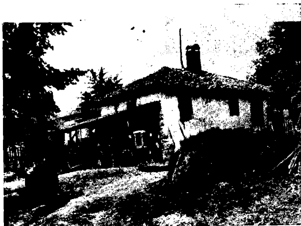
Фот. 2. — Тип старије куће у селу Николичеву. Поред овог старог је нови елемент културе: трантор под настрешницом. (Снимио: августа 1972. Мих. М. Ностић)