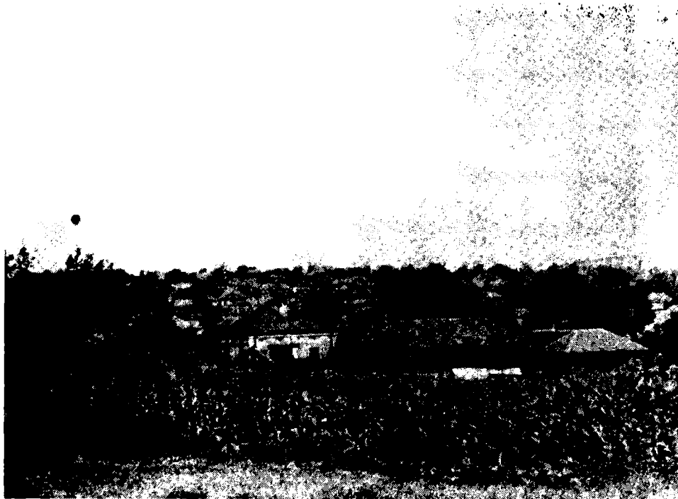
Фот. 1. — Полонај и изглед села Николичева (Зајечарска котлина). (Снимио: августа 1972. Мих. Ностић)