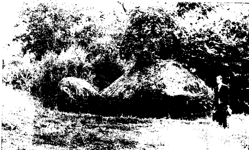
Фот. 4. — Тип сточарске нолибе („појате“) у Сврљишној нлисури, на сентору Сврљишке (Нишевачке) Бањице. Са опадањем овчарства оваква сточарска станишта ишчезавају.