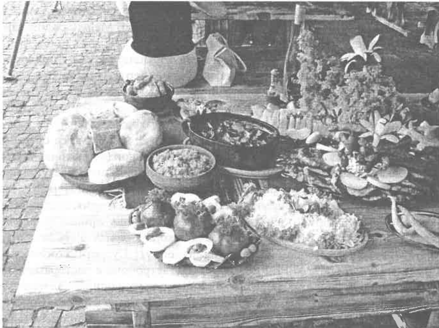
Слика 2 Детаљ са Гастрофеста, такмичења угоститеља Чачак Photo 2. Detail from Gastrofest, Čačak

вина (Стара Моравица), Куленијада (Сремска Митровица), Бостанијада (Шашинци). Гастро фестивал (Чачак)