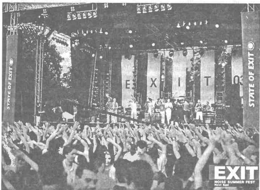
Слика 1 Exit 2004, Петроварадинска тврђава Photo 1. Exit festival

Позоришне манифестације , према извођењу разликујемо: аматерске и професионалне. Обухватају такмичења и смотре позоришта великих и малих сцена и такмичење и смотре професионалних позоришта лутака.