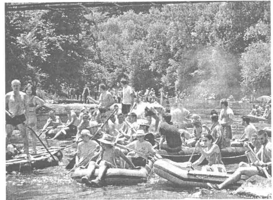
Слика 5. Регата Весели спуст, река Ибар код Краљева Photo 5. Regatta Veseli spust on river Ibar, near the Kraljevo