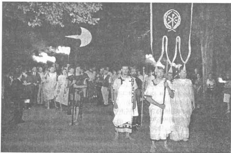
Слика 3 Градска Слава града Ниша, Свети Константин Photo 3. Glory of ST. Konstantin, city glory of Niš

Верске свечаности представљају атрактивну туристичку вредност. Односно, верске туристичке манифестације су оне које имају атрактиван религијски садржај и значај. Оне могу бити повезане са одређеним верским празником (Божих, Ускрс) или са местима одређеним за обављање религијских обреда, као и догађајима из историје цркве, обележавањем датума значајнијих пророка, апостола, светитеља.