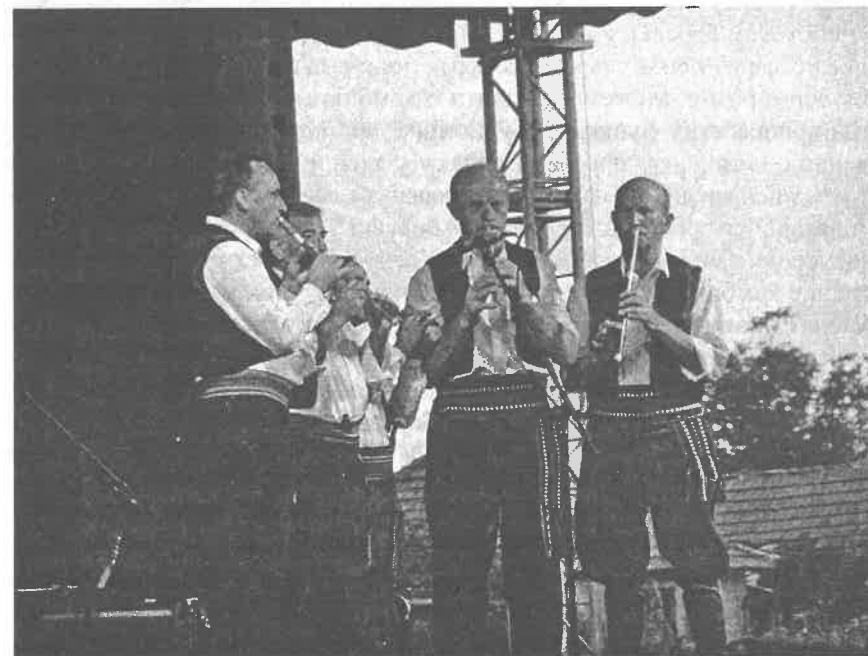
Слика 4 Сабор фрулаша Србије (Прислоница), Photo 4 Convention of frula players on Serbia in Prislonica

ђанском насељу), Сабор народног стваралаштва „Златне руке Србије“ (такмичење општинских и регионалних победника у припремању традиционалних јела, плетилца, везилца, ткаља и беседничара и смотра најлепших народних ношњи и ручних радова, а одржава се сваке године у другом насељу Србије), Фестивал фолклорних ансамбала Србије (Пожаревац), Буњевачко прело, Дужијанца (Суботица), Сабор Стојана Чупића (Салаш Ноћајски), Дани азањске погаче (Азања), Дани новог хлеба (Кањижа), Такмичење у припреми пита – Питијада (Чачак), Жетелачки дани (Војловица), Србобранска бразда (Србобран).